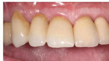
Abbildung: „Die Brücke mit dem Dreh“ - Impressionen aus dem Gewinnervideo des Filmfestivals 2020 von ZT Reinhard Busch, Universität Kiel