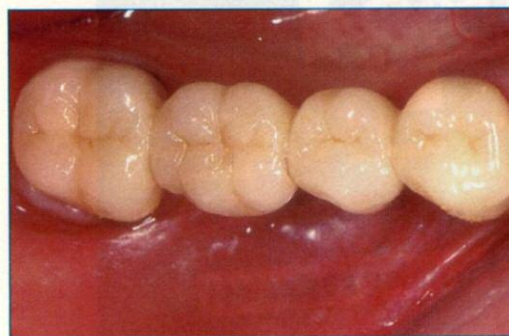
Abb. 2: Brückenrestauration 45–47 mit ZrO 2 -Gerüst, sieben Jahre frakturefrei in situ